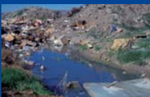
1 Urbanizaciones cercanas a un humedal